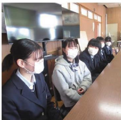
最初は緊張している様子でしたが、段々と笑顔が増え(上)、インタビュー後は、教頭先生からのお菓子の差し入れをおいしくいただきました!(下)

普段自分達が目にしていくものでも、どうやって作られているか分からないことが多い中で、それを知れることは面白いです。情報デザイン科では、映画などの映像づくりに憧れがあるので、そんなことができたなら。環境科学科では、作ったものに異常がないか検査する品質管理の授業があり、ものづくりに関わる仕事なんだなと感じています。この高校だけでなく、たくさんの「つくる」に関する切り口があり、他の学科が学んでいる内容も気になります。