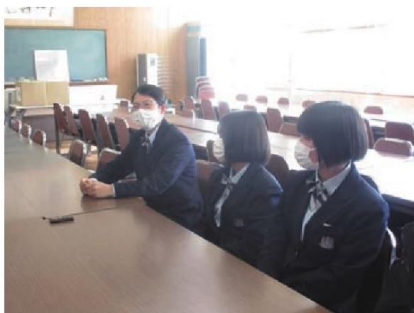
終業式のあとに、インタビューのために様々な学科の女子生徒たちが集まってくれました。

先生の個性が強いです(笑)。他校の友人に聞いても、そんな先生いないよ！と言われるくらい、フレンドリーで面白い方ばかりです。自動車科と航空産業科には、イケメンの先生が多いですね(笑)。今年新たに購買ができ、ローソンの移動販売車や近所のパン屋・ペンギンベーカーが出張販売で来てくれるのでうれしいです。あとは、やっぱり男子が多いので、行事などでの盛り上がりやすいです。体育祭では、先生vs生徒の綱引きがあり大盛り上がりでした。